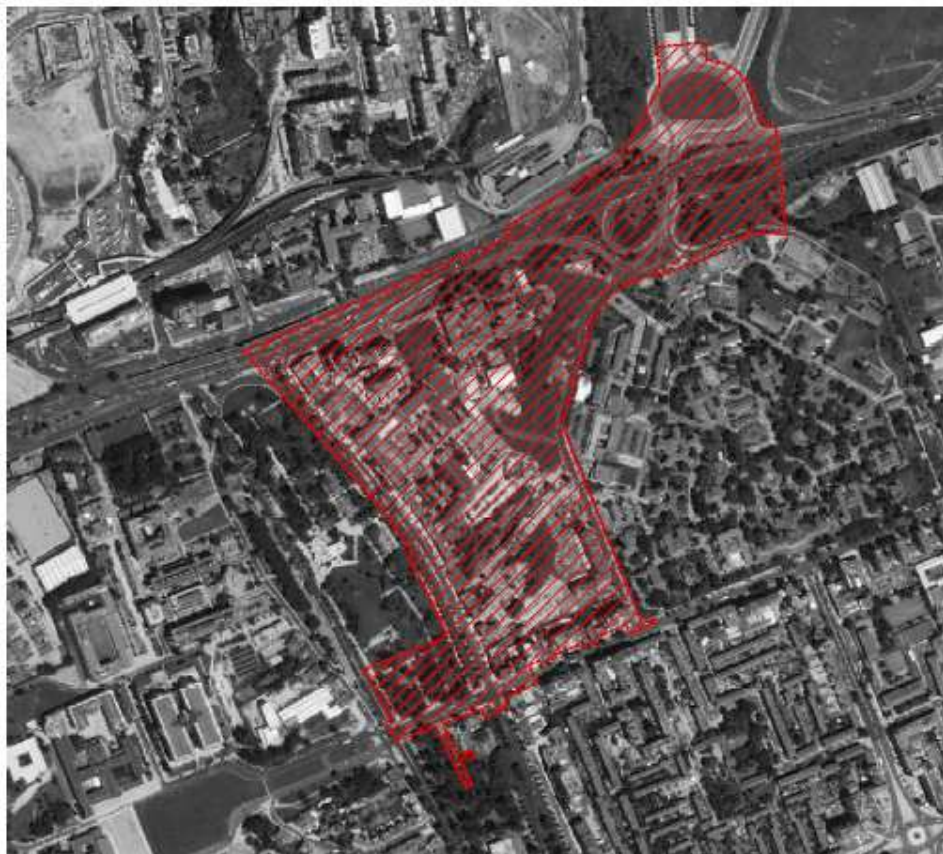
Delimitação da ARU Campo Grande – Calvanas

do Brasil e o núcleo maioritariamente habitacional do Bairro de Alvalade; a ponte pelo Campo Grande, o Museu de Lisboa – Palácio Pimenta e área de equipamentos de ensino da Universidade de Lisboa.